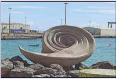
MUSEO DE UNAMUNO