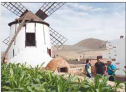
EL MOLINO DE ANTIGUA

Centro típico turístico (Tipo museo rural ) Tourist centre (rural museum type)